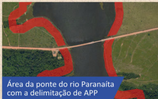
Área da ponte do rio Paranaíta com a delimitação de APP