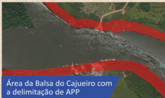
Área da Balsa do Cajueiro com a delimitação de APP